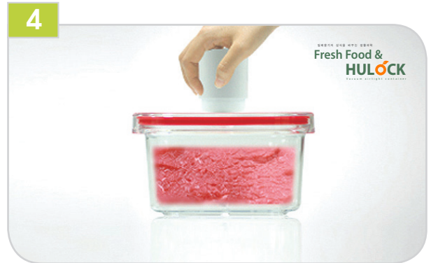
4 진공펌프를 잡고 아래위로 3~5회정도 작동하면 끝!