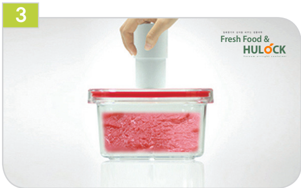
3 용기뚜껑의 가운데 홈에 진공펌프를 맞추어 놓습니다.