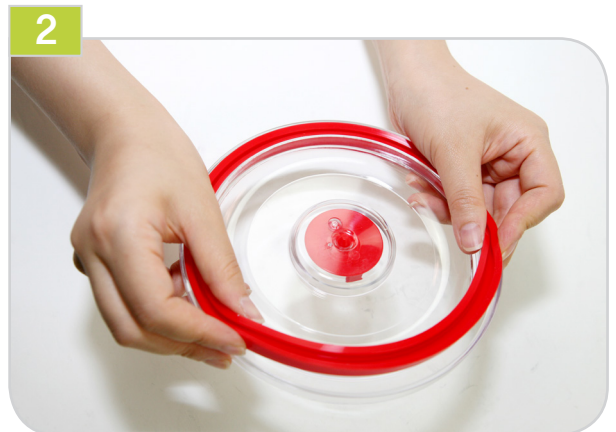
2 패킹의 홈이 있는곳이 아래로 향하도록 넣고 패킹 전체를 꼼꼼하게 손가락으로 눌러줍니다.