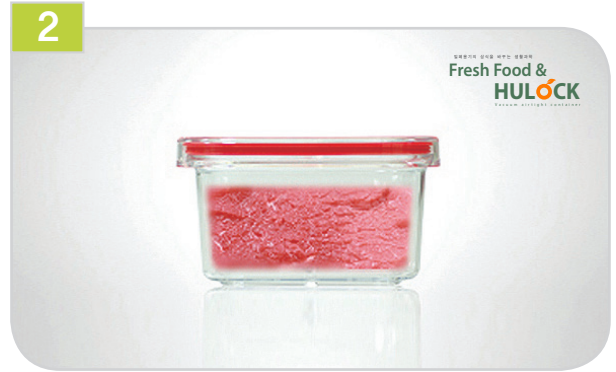
2 음식물이 담긴 용기위에 뚜껑을 눌러서 담습니다.