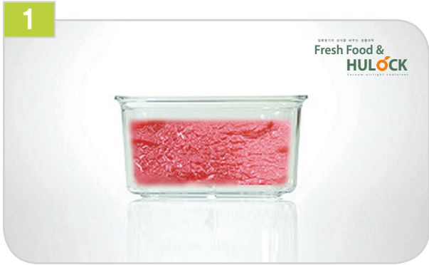
1 용기에 음식물을 85%가 넘지 않도록 담아줍니다.

휴락은 일반 밀폐용기와 다른 진공방식의 밀폐용기입니다. 아래 설명은 용기의 공기를 빼고 사용하시는 방법입니다.