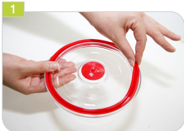
1 실리콘 패킹을 잡고 홈 밖으로 잡아당기면 뚜껑에서 패킹을 손쉽게 분리할 수 있습니다.